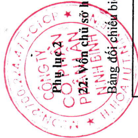
Bảng đối chiếu biến động của vốn chủ sở hữu